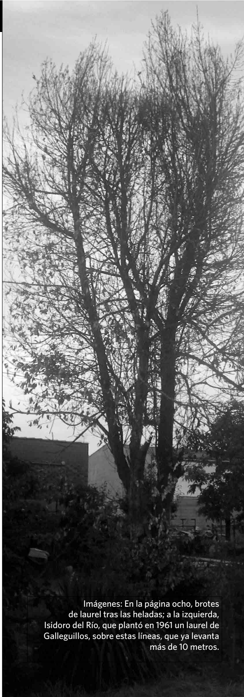
Imágenes: En la página ocho, brotes de laurel tras las heladas; a la izquierda, Isidoro del Río, que plantó en 1961 un laurel de Galleguillos, sobre estas líneas, que ya levanta más de 10 metros.