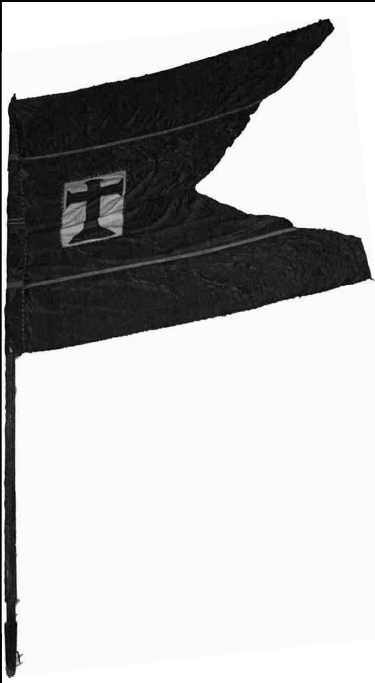
Imagen del pendón de Grajal de Campos

Investigación realizada por: JAVIER LAGARTOS PACHO