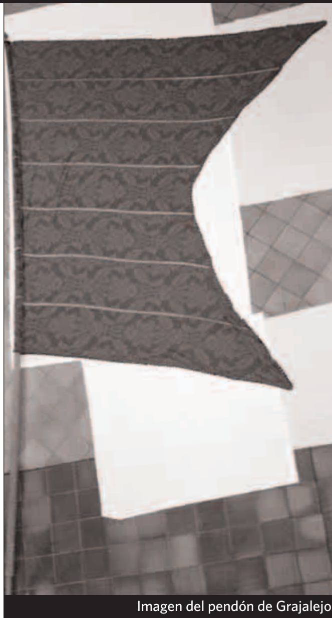
Imagen del pendón de Grajalejo

Descripción: La base de la cruz es de sección circular so-