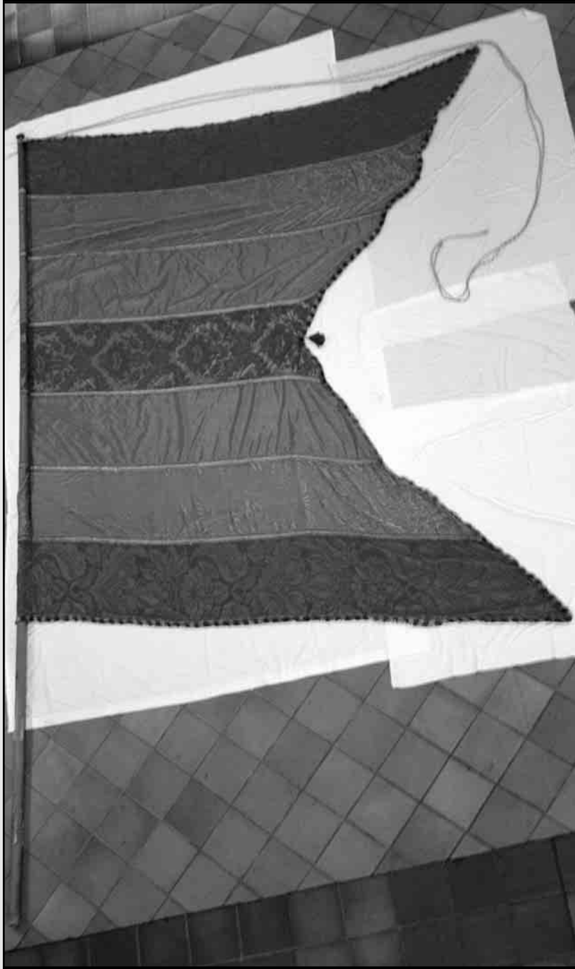
Imagen del pendón de Las Grañeras